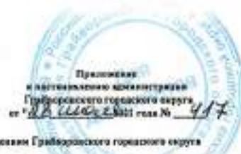
Данные погребения захоронения на 2012 г. по муниципальным учреждениям Грибовского городского округа