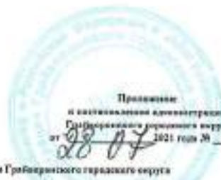
Листы ТК0 на 2021 г. по муниципальным учреждениям Государственного геральдического округа